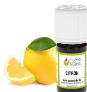
20 gouttes d'huile essentielle de citron (optionelle)