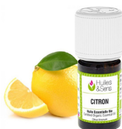
20 gouttes d'huile essentielle de citron (optionelle)