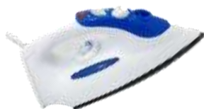
Fer à repasser